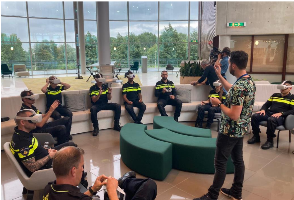
Illustratie 3. Deelnemers doen de simulatie en gaan daarna met elkaar in gesprek over de uitkomsten

Ten slotte is gebleken dat wat betreft presence - een eigenschap die van groot belang is voor het effectief overbrengen van trainingsmateriaal – en engagement de 360°-VR trainingen het best beoordeeld werden; hetzelfde was het geval voor het plezier dat de deelnemers ervoeren in de simulatie.