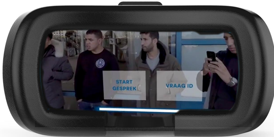
Illustratie 1. Nadat deelnemers iemand hebben geselecteerd voor een gesprek kunnen zij kiezen hoe zij dat contact willen starten.

deelnemers, die ieder een eigen VR-bril dragen, kunnen de film tegelijkertijd ervaren en daarin individuele keuzes maken. In de simulatie bepalen zij welke personen geselecteerd worden voor een gesprek. Daarna kunnen zij beslissen welke bevoegdheden desgewenst ingezet worden om het contact tot een gewenst einde te brengen. Dat kan een aanhouding of boete zijn, maar ook het wegsturen van iemand of vriendelijk afronden van een gesprek behoort tot de mogelijkheid (zie illustratie 1 en 2).